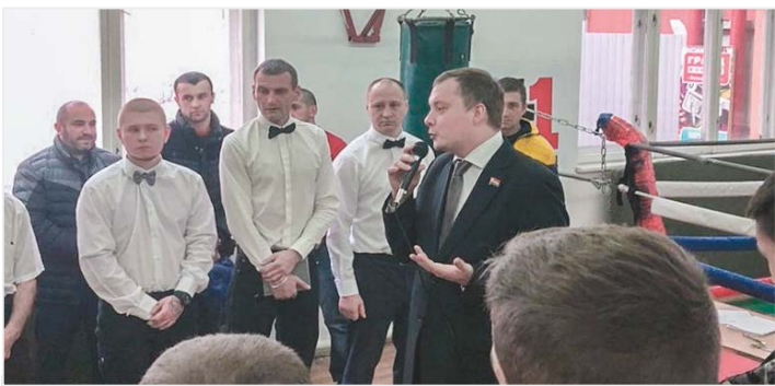
Напутственное слово депутата

Все участники соревнований получили от КРОПП ЛДПР свою долю поощрения. •