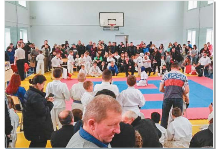
Перед началом боев