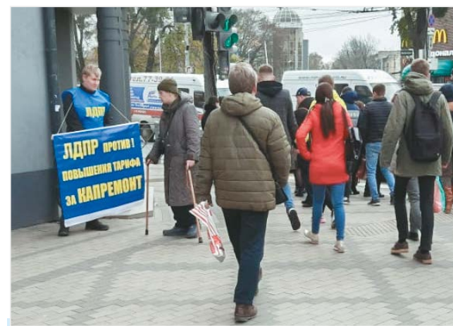
Пикет на ул. Черняховского

«Прохожие высказывали одобрение нашим действиям. Говорили,