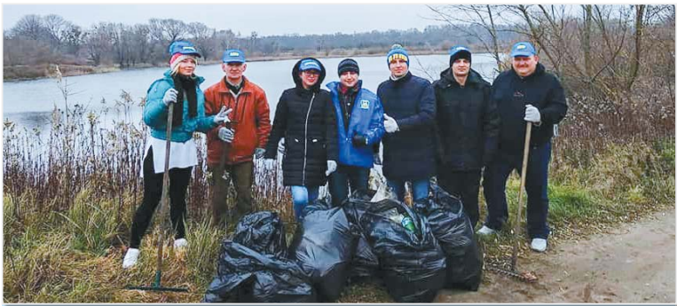
Активисты Центрального МО ЛДПР