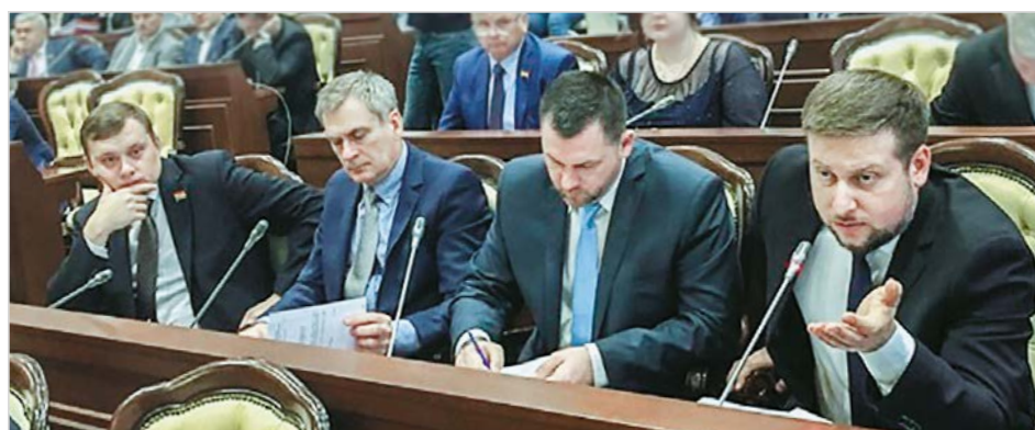
На заседании Калининградской областной думы

• Ремонт кровли здания Дома культуры в пос. Новосёлово Багратионовского р-на, ул. Центральная, 12. Бюджетное финансирование 2 451 987 руб.