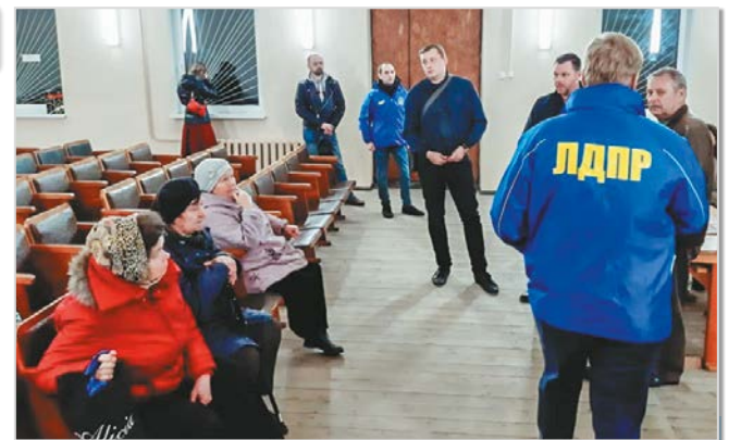
Встреча с жителями Тимофеевки