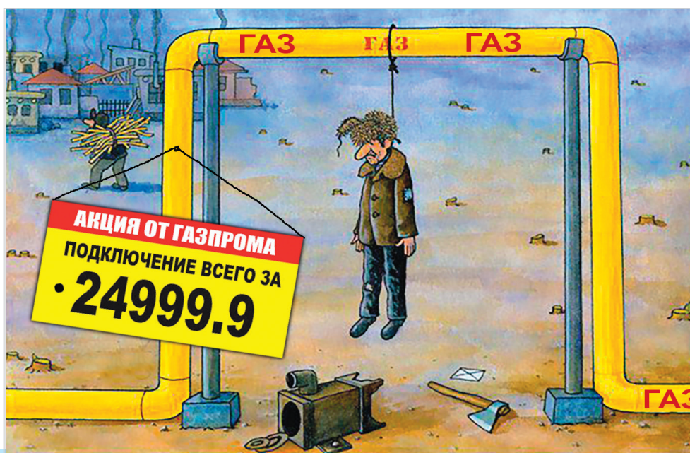
Тарифы такие - хоть вешайся

Решением правления Службы по государственному регулированию цен и тарифов Калининградской области от 27 декабря 2018 года №121/18 утверждены новые тарифы за технологическое подключение к газораспределительным сетям в регионе.