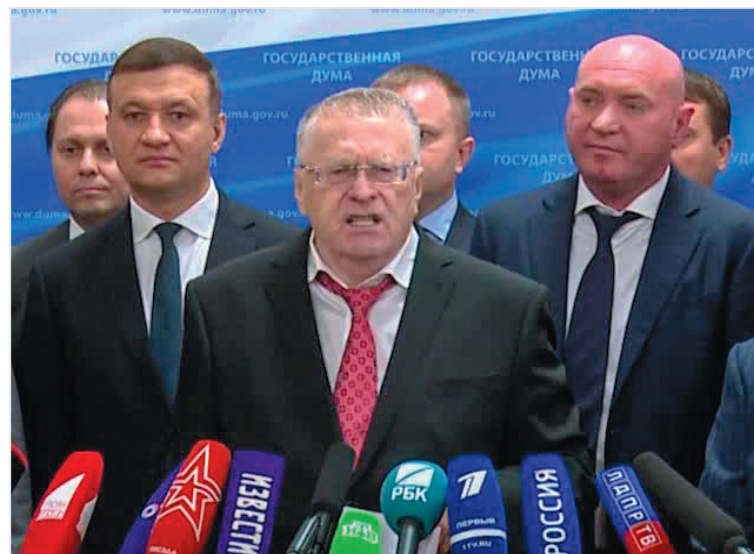
Лидер ЛДПР Владимир Жириновский

Он предлагает ввести в штат каждого начальника заместителя от ЛДПР. «Главное, чтобы у руководителя заместителями были люди от другой партии – только так мы остановим коррупцию. Деньги тот же наркотик – бесполезно чиновников уговаривать, бесполезно переходить на электронный документооборот, слежение, видеокамеры. Нужно, чтобы сидел другой человек рядом с ним, который будет следить! А все остальное бесполезно», – объяснил лидер ЛДПР. •