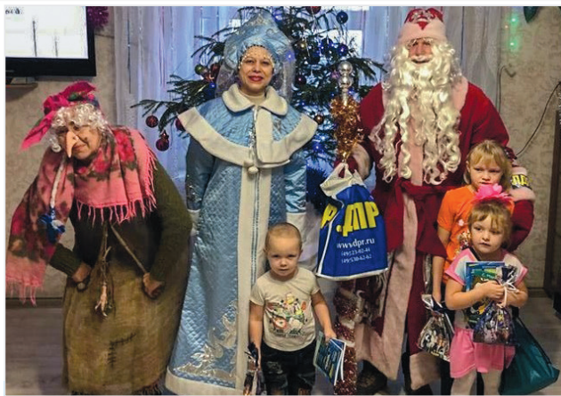
ЛДПР поздравляет детей

Порядка 1500 сладких подарков для маленьких калининградцев подготовило КРОПП ЛДПР на Новый год и Рождество.