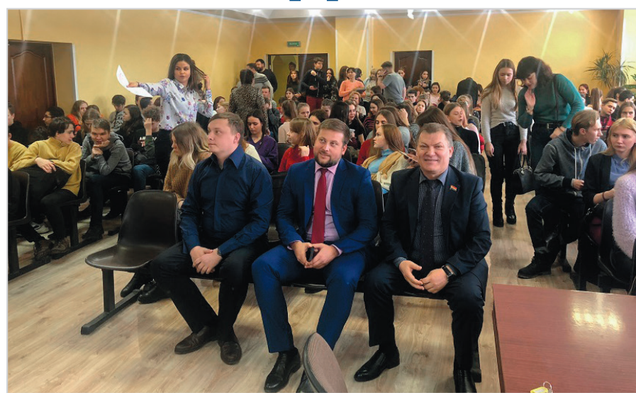
В гостях у студентов РАНХиГС

Затем парламентарии встретились с руководителями колледжа и обсудили с ними проблемы учебного заведения. •