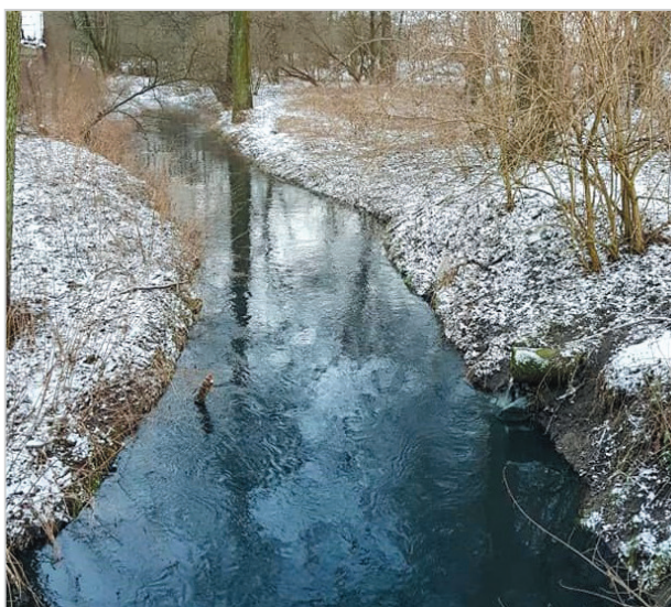
Экологическое состояние р. Лесная ухудшается

«Меня так же интересует вопрос: справляется ли новый городской коллектор, который буквально месяц назад был введен в эксплуатацию после исправления брака, с таким объемом застройки в данном микрорайоне», – подчеркнул депутат от ЛДПР. •