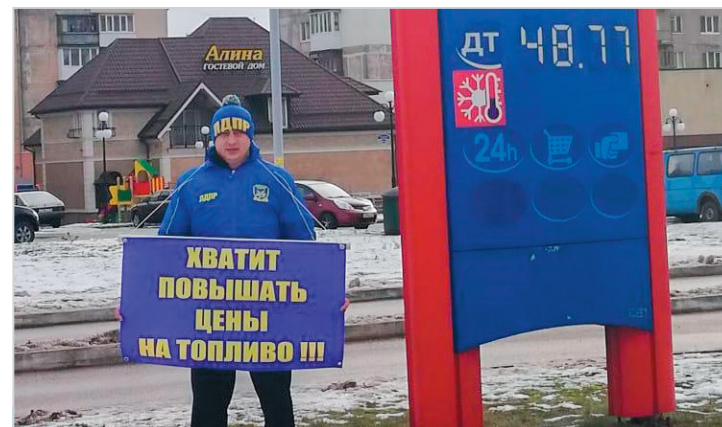
Пикет у одной из АЗС Светлогорска

«Из всех партий только ЛДПР не смирилась и продолжает выступать против повышения цены на бензин, – говорили прохожие. – Такая позиция, которую придерживаются все без исключения калининградцы, вызывает уважение». •