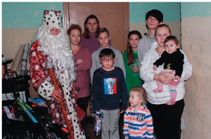
Визит Деда Мороза на Рождество

К праздничному столу сладости пришлось очень кстати, благодарили Калининградское региональное отделение ЛДПР местные жители.