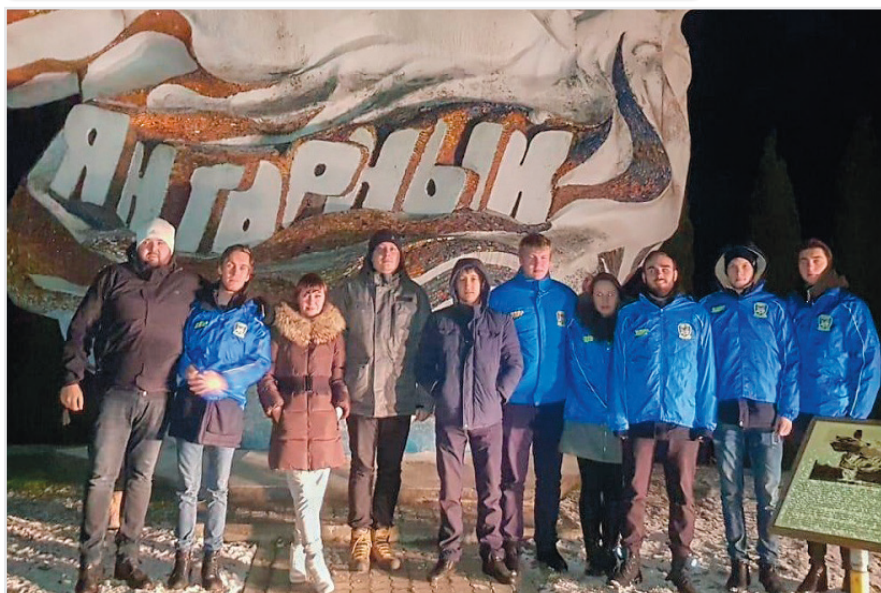
На Крещение в Янтарном

ЛДПР обогрела купающихся в православный праздник Крещение Господне.